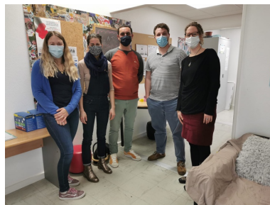
Réunion de l'antenne Caen avec la direction du CADA d'Hérouville Saint-Clair

Association solidaire et sociale d'ostéopathes